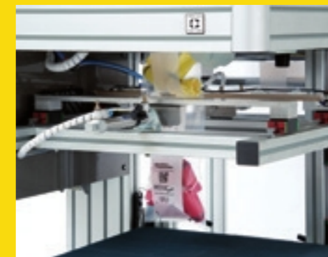
Opcja podwójnych worków