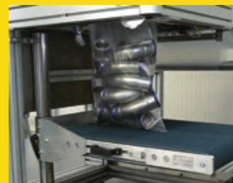
Ciężki produkt podtrzymywany przez dedykowany przenośnik odprowadzający