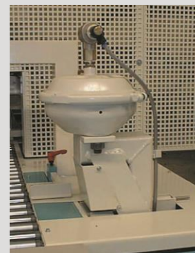
Wykrawarka euro otworu