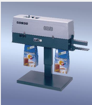
400 DSM z stojakiem