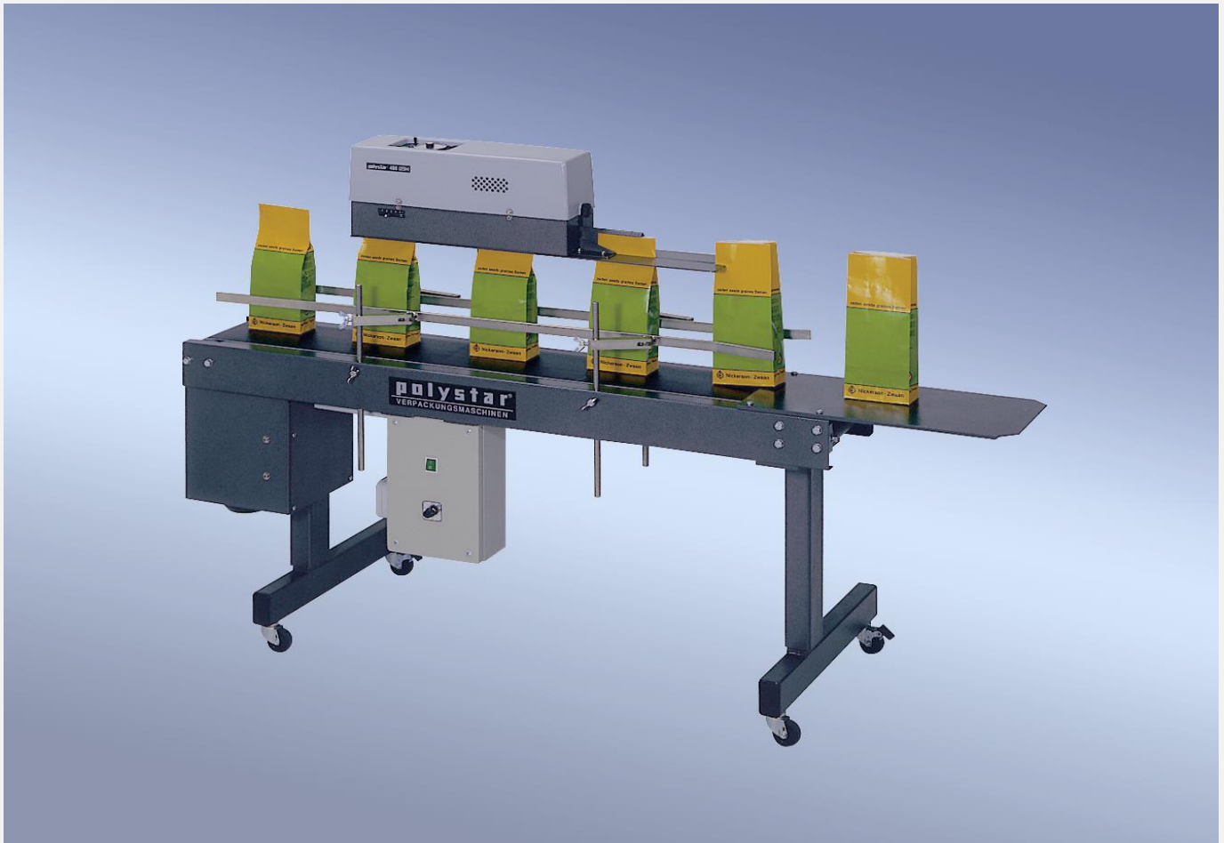
polystar® 400 DSM z przenośnikiem podłogowym

ZGRZEWRKI ROTACYJNE Zgrzew ciągły – stały do folii laminowanych i PP