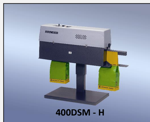
400DSM - H