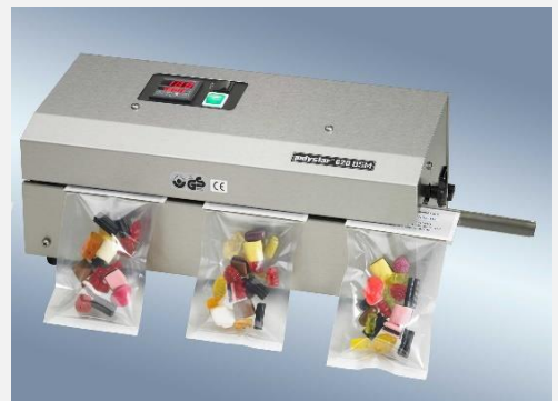
620 DSM-HC zgrzewarka kartonik folia