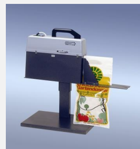
polystar® 350 DSM-H

Dystrybutorem zgrzewarki jest firma ASTRAPACK