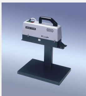
polystar® 350 DSM