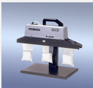
polystar® 350 DSM-TE