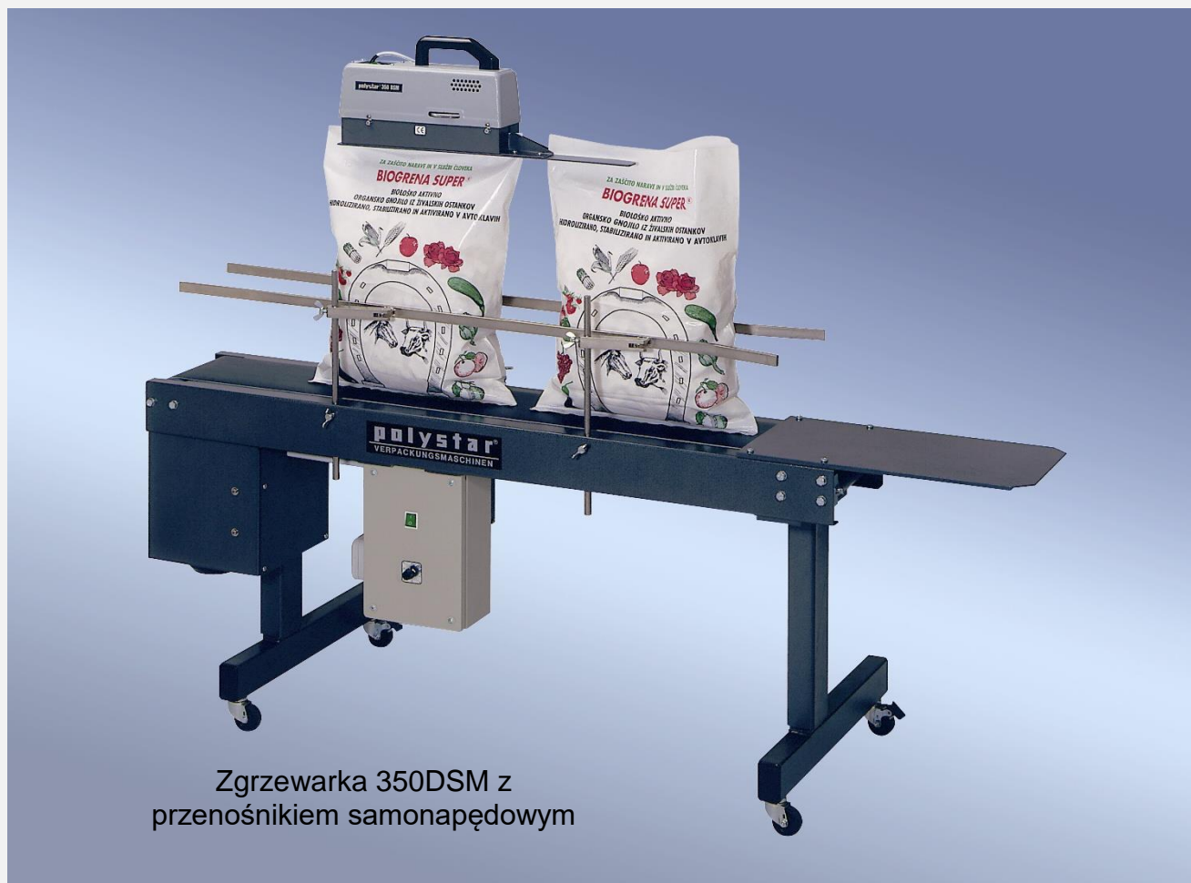
Zgrzewarka 350DSM z przenośnikiem samonapędowym

dla folii PE - polietylen oraz PP - polipropylen