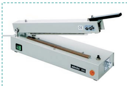
polystar ® 244