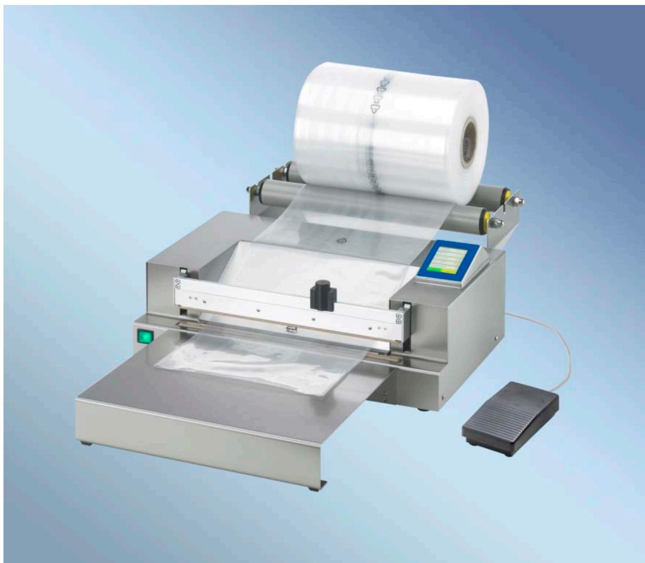
polystar® 438 M z podajnikiem rolki folii i stołem roboczym

Automatyczna Zgrzewarka do folii PE, PP, Laminaty, AL folia, TYVEK